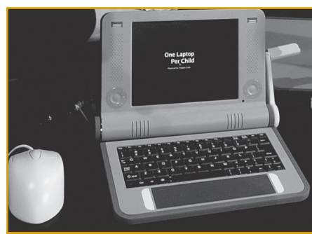
V Tunisu byla také odstartována iniciativa stodolarového laptopu určeného zejména pro obyvatele rozvojového světa.

„Lepší přístup k informačním technologiím může přispět ke zdokonalení farmářských praktik a napomoci