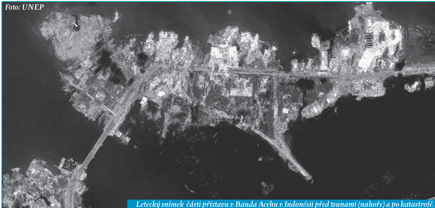
Letecký snímek části přístavu v Banda Aceh v Indonésii před tsunami (nahore) a po katastrofě.