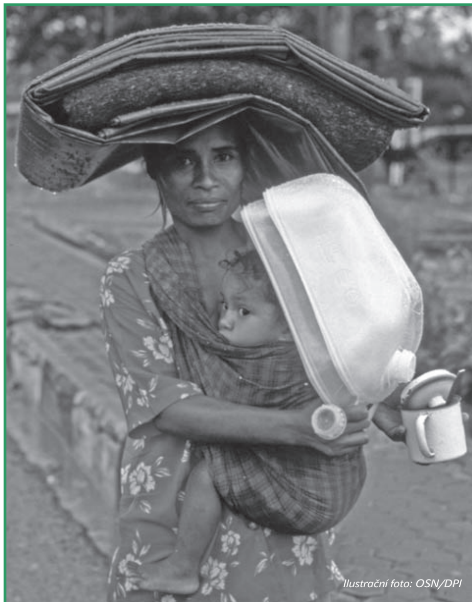
Ilustrační foto: OSN/DPI