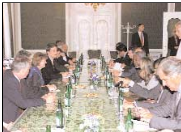
Setkání s předsedkyní senátu Libuší Benešovou