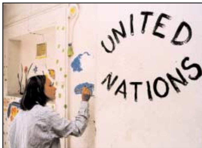
Dětské kresby zdobí vstup do Informačního centra OSN v Praze.

Generální tajemník: Moje odpověď na vaši první otázku je