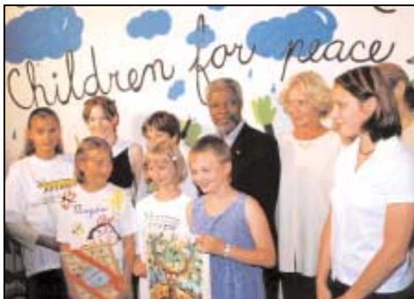
Kofi Annan a děti z nadace Stonožka