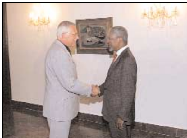
S předsedou poslanecké sněmovny Václavem Klausem