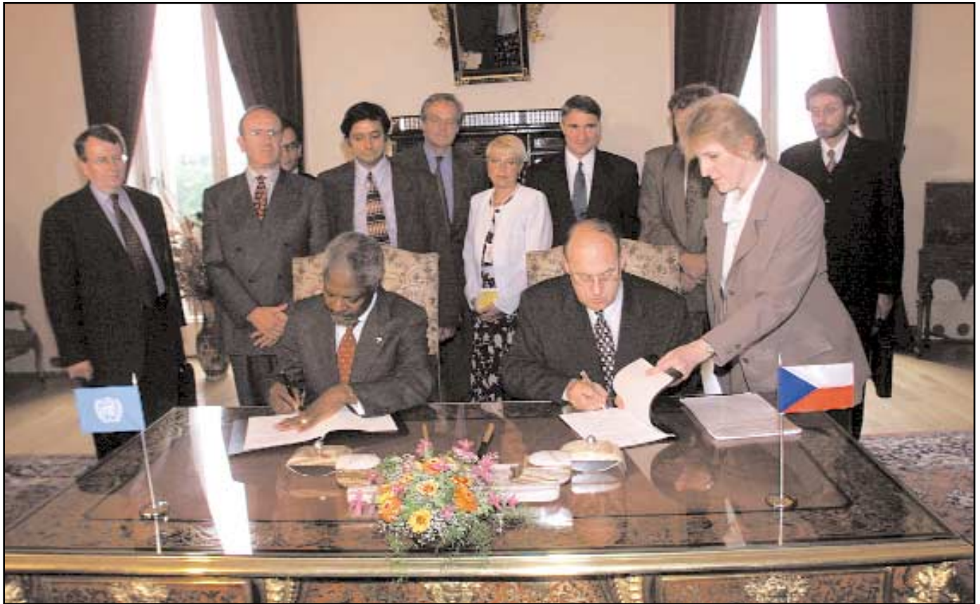
Podpis dohody o Informačním centru OSN: Generální tajemník Kofi Annan a Jan Kavan, ministr zahraničí ČR. Dohoda formalizuje statut Informačního centra OSN v Praze a přítomnost OSN v České republice.