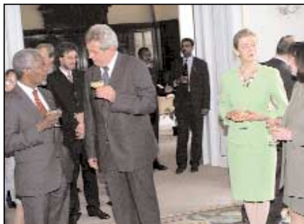
Kofi Annan a předseda vlády Miloš Zeman