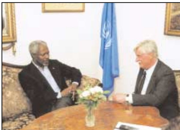
Rozhovor se zvláštním zpravodajem pro lidská práva Jiřím