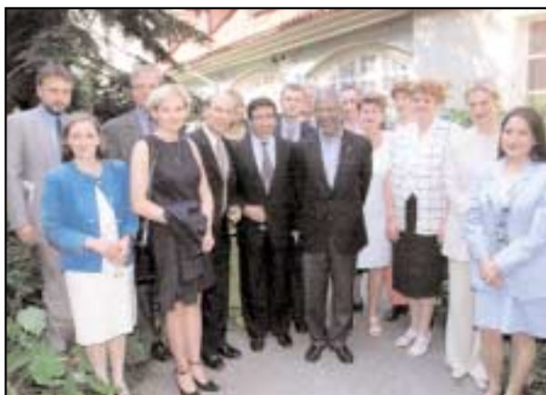
Setkání s pracovníky informačního centra a dalších agentur