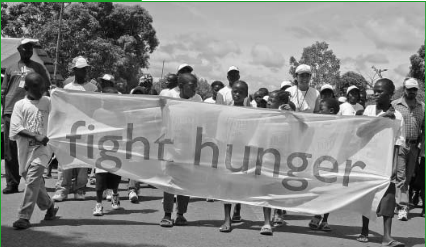
Pochod proti hladu 2006. Tubmanburg, Libérie.

Z údajů Světového potravinového programu ( www.wfp.cz )