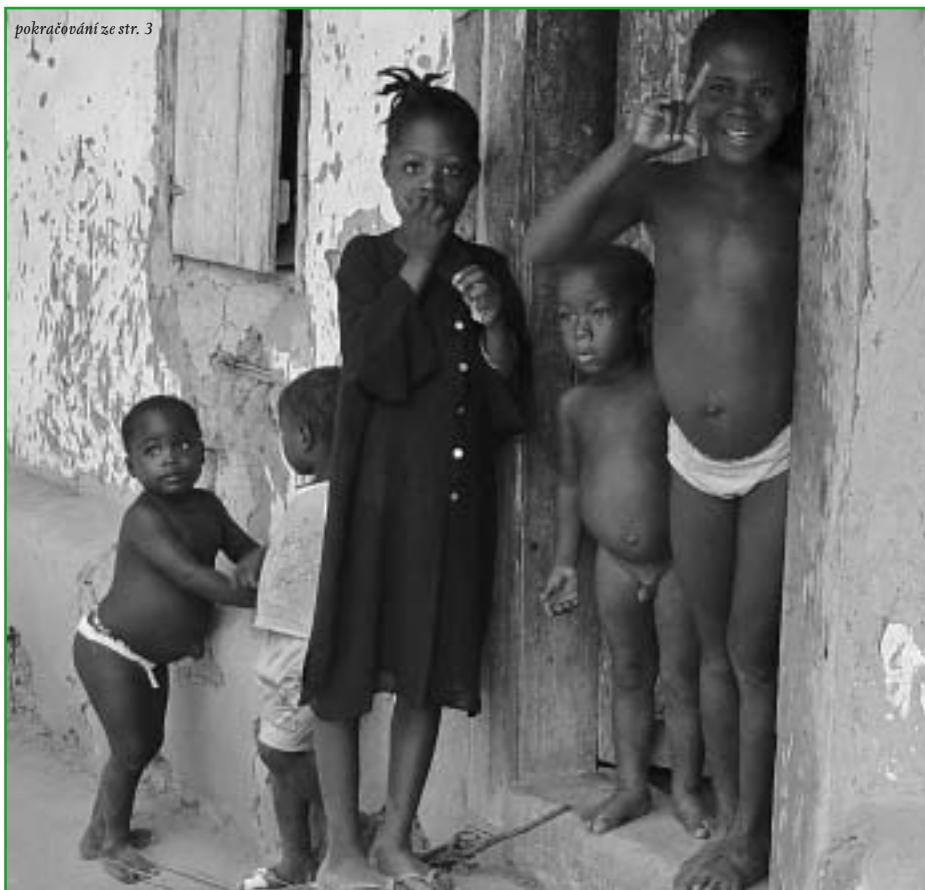
V Africe je osmkrát vyšší dětská úmrtnost než v Evropě. Hlavním důvodem je podvýživa.