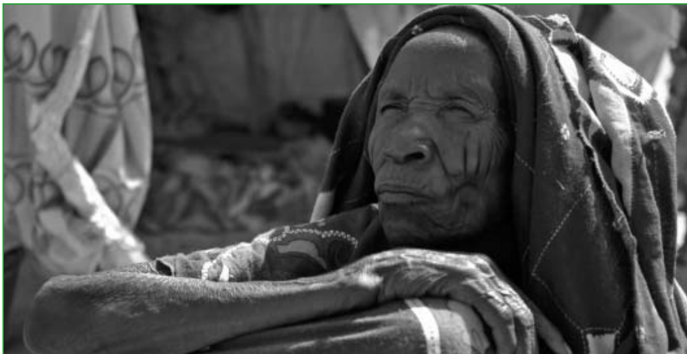
Dárfúrská žena v uprchlickém táboře Iridimi ve východním Čadu.