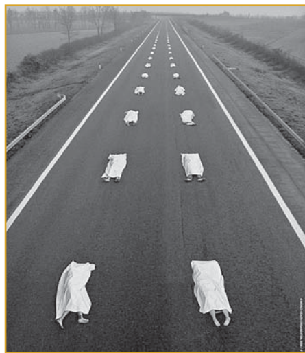
Varovný plakát WHO ke kampani.