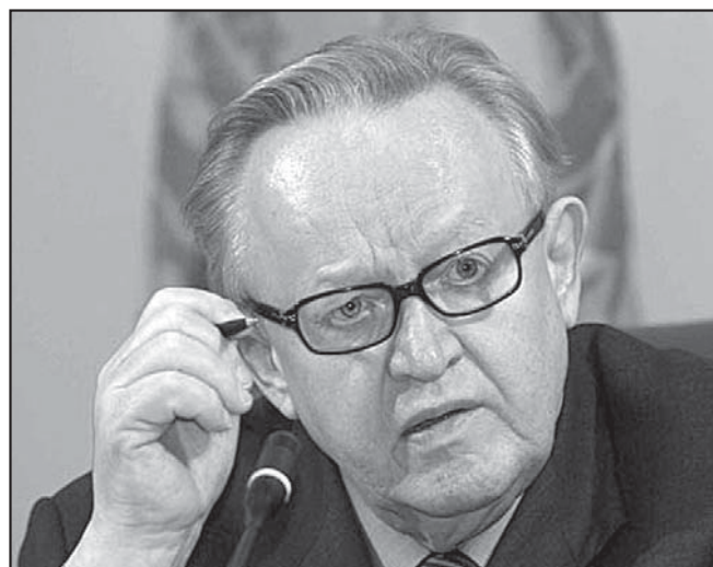
Zvláštní zmocněnc generálního tajemníka OSN Martti Ahtisaari na tiskové konferenci ve Vídni po ukončení jednání mezi srbskou a kosovskou stranou.

Provizorní plán, který zvláštní zmocněnc generálního tajemníka OSN předložil 2. února, se zabývá požadavky na vznik multietnické společnosti, jejíž ústava obsahuje potřebné zása-