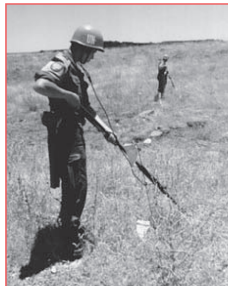
Polský voják odminovává území oddělení. (Foto OSN, 1974)

V prosinci 1981 se izraelská vláda rozhodla uplatňovat izraelskou legislativu na území okupovaných Golanských výšin. Proti tomuto kroku však Sýrie silně protestovala a Rada bezpečnosti i Valné