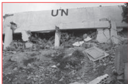
Pozorovatelská stanice OSN u jiholibanonského města Chiam zasažená během leteckého bombardování 24. července.

Rada bezpečnosti již dříve prostřednictvím svého předsedy reagovala na dva incidenty tohoto konfliktu. Jedním bylo zabití čtyř neozbrojených vojenských pozorovatelů OSN, příslušníků Pro-